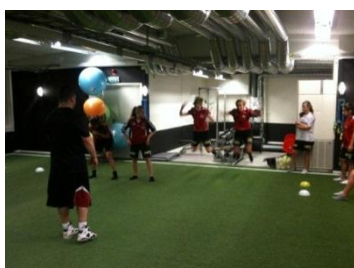
BP F97 -1

En hel del föreningar har redan hunnit besöka vårt center som ligger ett stenkast från Sollentuna pendelstation och Sollentuna Centrum. Idrottskillar och tjejer från idrotter som hockey, fotboll, handboll, innebandy, konståkning, slalom och basket har tagit del av tester, träning och föreläsningar som berör talang och elitutveckling men framför allt inriktar sig på hur unga idrottare med eller utan talang kan förbereda sig fysiskt för att kunna bli starka, snabba och hålla sig skadefria när belastningen i framtiden ökar med ökad träningsdos och tuffare tag efter puberteten.