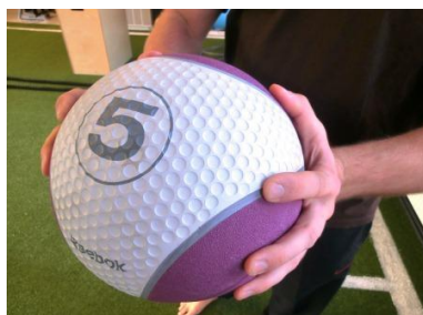
Träningsredskap från Reebok