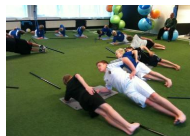
SK Iron Hockey -99

Flera individuella idrottare från kampsport, tennis och golf har testat sig i rörlighet som går som den röda tråden i träningsupplägget hos Ultimate Performance. Alla som vill träna med Ultimate Performance börjar alltid med att testa sin rörlighet. Det lägger grund för formen av träning. Med fullgod rörlighet är det sedan lättare att utveckla både styrka och kraft specifikt för sin idrott. På ett Performance Center blandas idrottsmedicin och rehab med prestation.