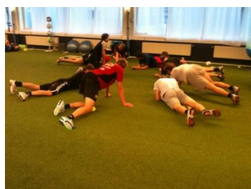
Fotbolls- och hockeyspelare Elit