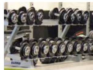
Träningsredskap från Eleiko

Träningen kan bedrivas ensam med en personlig tränare, tillsammans i mindre grupper, som lag eller hel förening där vi, Ultimate Performance, sätter den röda föreningstråden när det gäller fysisk träning och motorisk utveckling från barn och ungdom till elit.